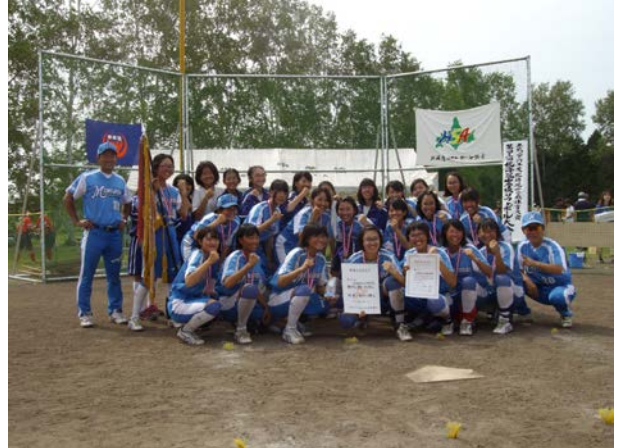
準優勝 札幌市立もみじ台南中学校