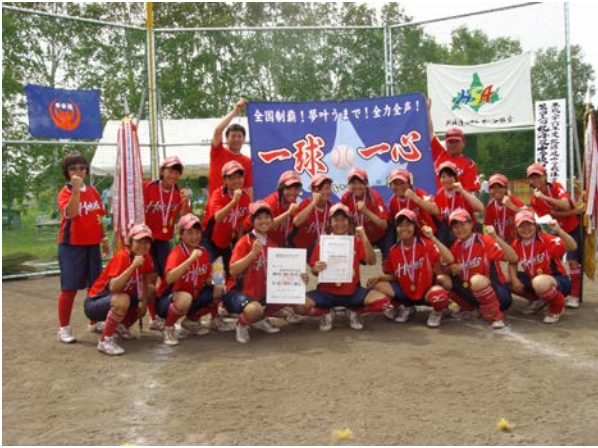
優勝 札幌市立北都中学校