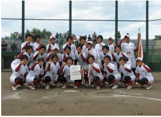
優勝 とわの森三愛高等学校