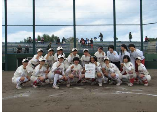
準優勝 帯広南商業高等学校